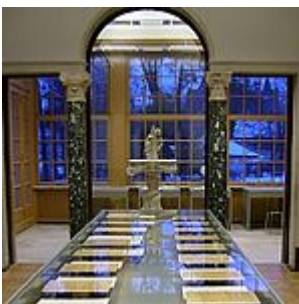
exposición, sala 9