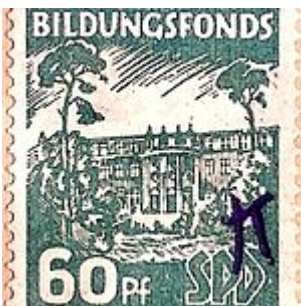
Bildungsfondsmarke der SPD