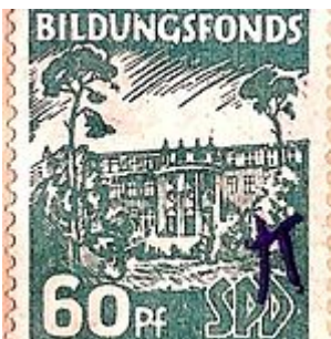
Bildungsfondsmarke der SPD