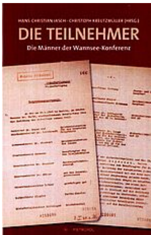
Jasch u. Kreutzmüller: Die Teilnehmer - Die Männer an der Wannsee-Konferenz. Berlin 2017

Die Lieferung erfolgt gegen Vorausrechnung.