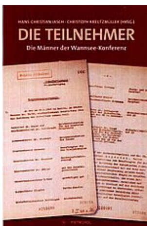
Jasch u. Kreuzmüller: Die Teilnehmer - Die Männer an der Wannsee-Konferenz. Berlin 2017

Die Lieferung erfolgt gegen Vorausrechnung + Porto.