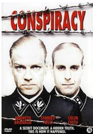
Conspiracy. DVD [NL/EN], HBO 2009