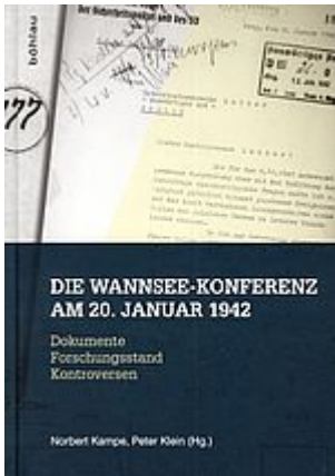
Die Wannsee-Konferenz am 20. Januar 1942. Köln 2013