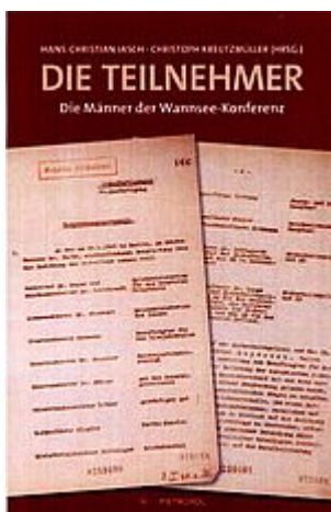
Jasch u. Kreuzmüller: Die Teilnehmer - Die Männer an der Wannsee-Konferenz. Berlin 2017

Die Lieferung erfolgt gegen Vorausrechnung + Porto.