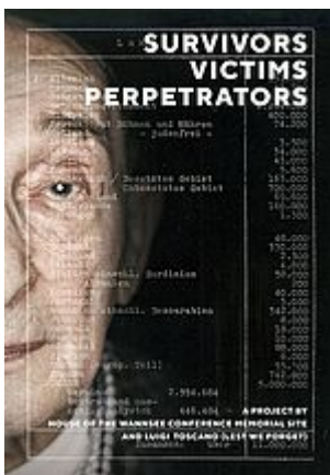
Survivors, Victims, Perpetrators