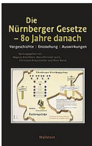
Die Nürnberger Gesetze - 80 Jahre danach