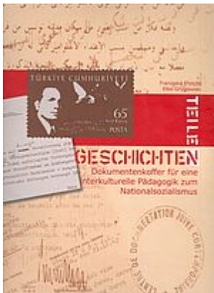
Dokumentenkit "Geschichten teilen". Berlin [Nachdruck] 2015.

Villencolonie Alsen am Großen Wannsee. Begleitband zur Ausstellung in der Gedenk- und Bildungsstätte Haus der Wannsee- Konferenz. Hrsg. von Michael Haupt. Berlin: Haus der Wannsee-Konferenz 2012 (Nachdruck 2017), 168 S. mit 184 Abb. ISBN 978-3-9813119-3-8, 7,50 EUR