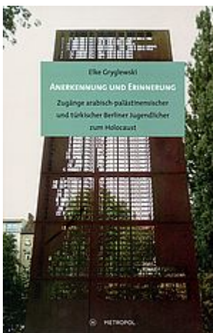
Anerkennung und Erinnerung