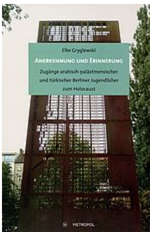
Anerkennung und Erinnerung