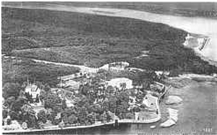
Grundstück Marlier/Minoux, Postkarte undatiert (Archiv: GHWK)

Um 1937 begann der Sicherheitsdienst des Reichsführers SS (SD), die verkehrsgünstig gelegene Villenkolonie am Wannsee als Standort für seine Dienststellen zu erschließen. Zahlreiche Grundstücke und Gebäude in der nächsten Nachbarschaft der Villa Marlier und Einzelgebäude im weiteren Umfeld wurden jetzt von der SS genutzt.