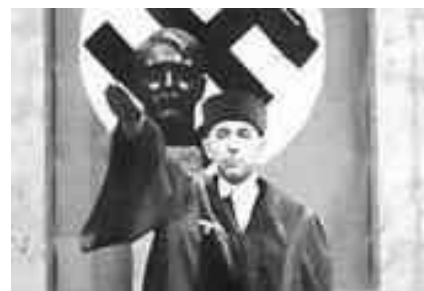
Roland Freisler (1893-1945)

Der grausame und systematische millionenfache Mord an den Juden wurde von staatlichen Behörden vorbereitet und ausgeführt. Die Dimensionen dieses Verbrechens machten eine sorgfältige Abstimmung der beteiligten Dienststellen erforderlich. Unter diesen Dienststellen war auch das Reichsministerium der Justiz vertreten durch den Staatssekretär Dr. iur. Roland Freisler. Auch die anderen beteiligten Ressorts wurden überwiegend durch Juristen vertreten.