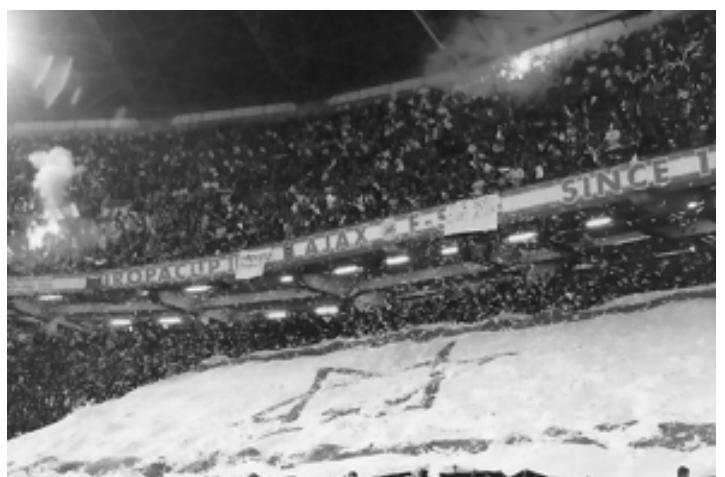
Fankurve im Stadion von Ajax Amsterdam

Dr. Dr. Wolf-Dieter Mattausch Bildungsabteilung, Haus der Wannsee-Konferenz