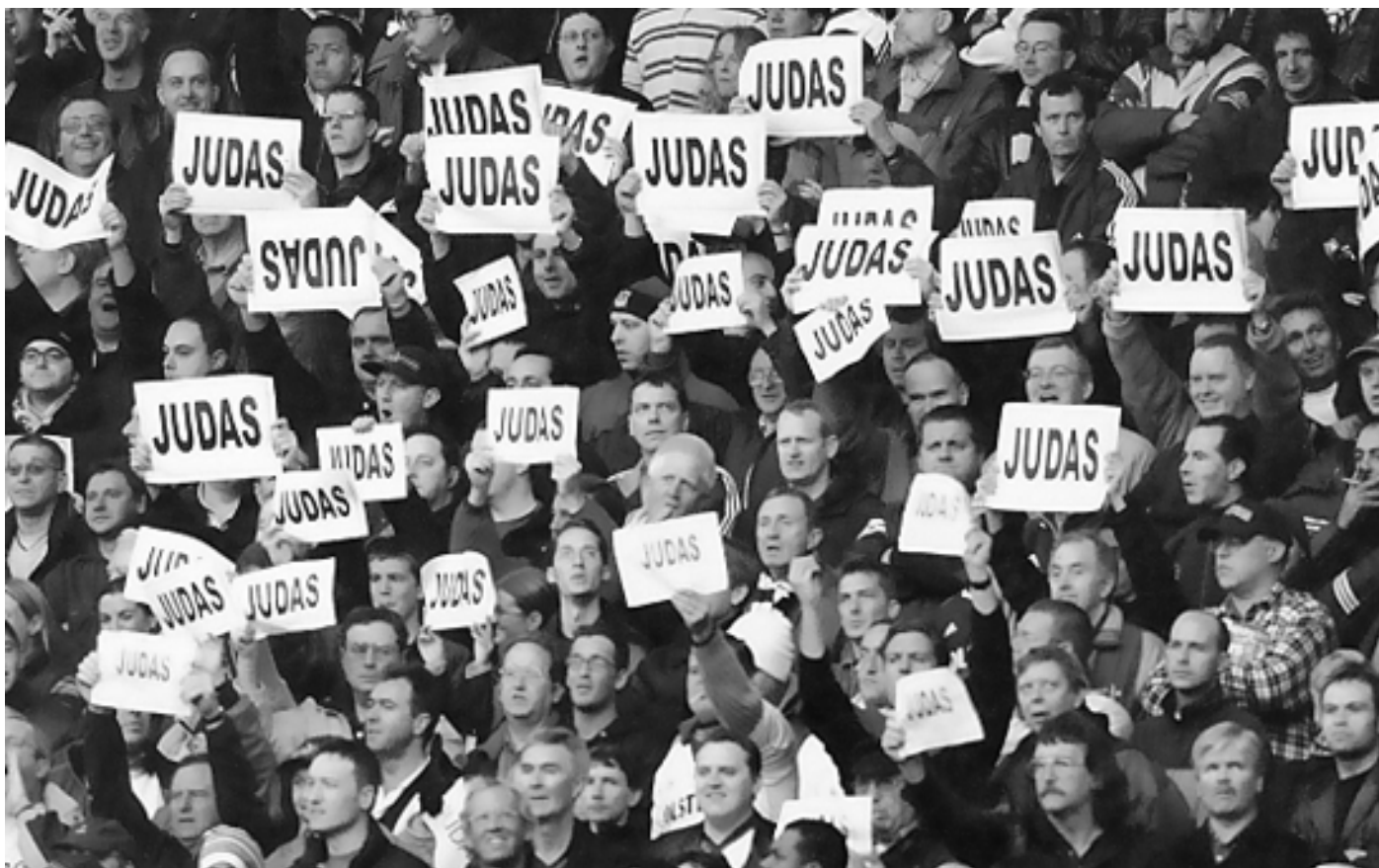
Fans von Tottenham Hotspur