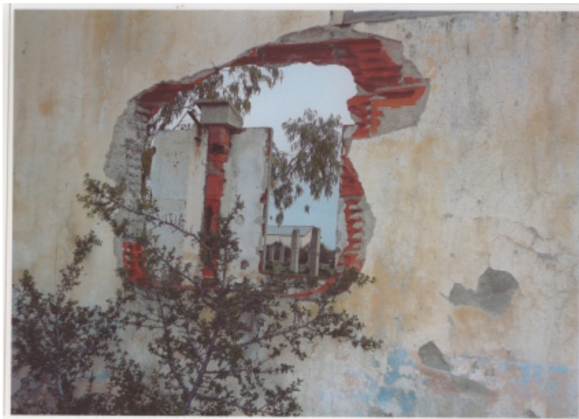
Rivesaltes: Durchblick durch Barackenmauern mit Resten von Bemalung. Foto: Erika Mor, 2006

Lore Kleiber, Bildungsabteilung der Gedenkstätte Haus der Wannsee-Konferenz