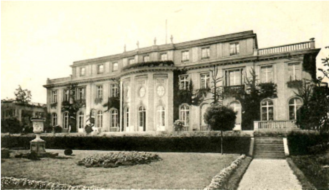
Villa Minoux, Briefpapier Minoux, ca. 1922