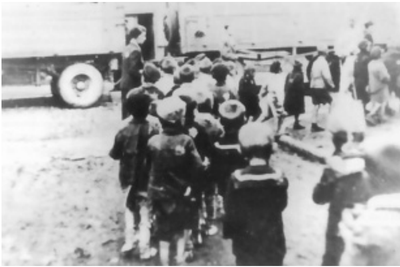
Deportation von jüdischen Kindern aus Łódź, nach Chelmo, September 1942

Die Kinder haben meist im Religions- oder Deutschunterricht etwas zu den Themen Judentum, Verfolgung, vielleicht auch KZ gehört. Die Kenntnisse sind unterschiedlich und reichen von minimalem Wissen bis zu einigem Detailwissen.