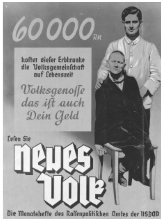
Propagandablatt zur Vorbereitung auf den Krankenmord, um 1938

gestaltet, das sie mitbringen, welche Wünsche und Bedürfnisse sie an die Inhalte und die Gestaltung des Tages haben und welche Ängste und Befürchtungen sie hinsichtlich der Auseinandersetzung mit dem Thema eventuell mitbringen. Gerade die Möglichkeit, emotionale „Hemmnisse“, äußern zu können, wirkt vertrauensbildend und hilft schon zu Beginn des Tages, mögliche Bedenken aus dem Weg zu räumen und eine offenere Arbeitsatmosphäre zu schaffen. Nicht selten stellt sich heraus, dass einzelne Teilnehmer/innen insofern einen persönlichen Zugang zum Thema mitbringen, weil es in der Verwandtschaft eine/n behinderte/n Angehörige/n gibt bzw. noch Zeitzeug/innen leben und sich im Kreis der Angehörigen äußern. Eine ganze Reihe von Teilnehmer/innen befürchtet, dass ihnen das Thema zu nah gehen und sie überwältigen könnte oder aber dass ihre Gefühle und Wahrnehmungen beeinflusst und in eine bestimmte Richtung gelenkt werden sollen. Schon aus diesem Grund bemühe ich mich darum, eine sachliche Beschäftigung mit den Themen des Studientages zu ermöglichen, ohne jedoch die emotionale Ebene zu vernachlässigen oder gar aufzugeben.