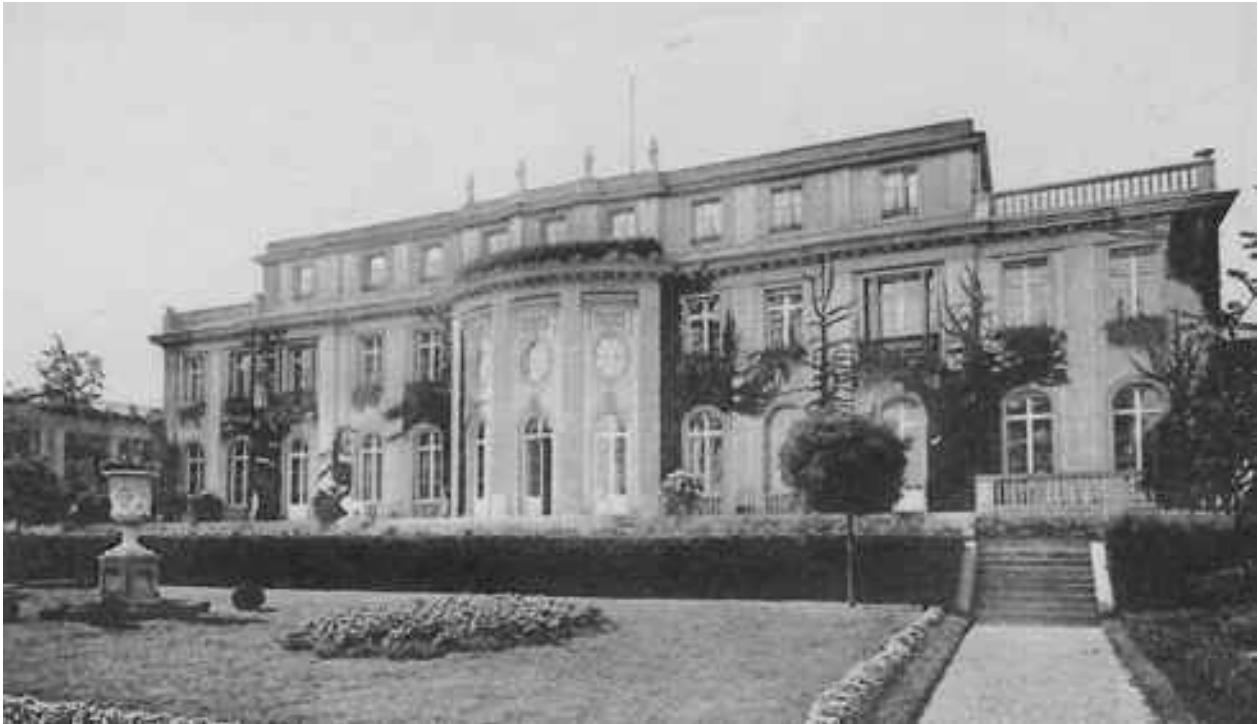
Villa Minoux, Briefpapier Minoux, ca. 1922