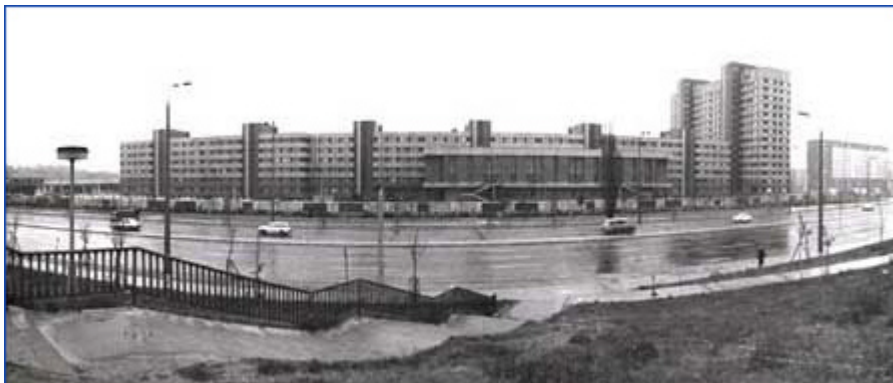
Der Gebäudekomplex der ehemaligen Bezirksverwaltung des MfS in Alt-Friedrichsfelde. Die Gebäude werden heute von der "Fachhochschule für Verwaltung und Rechtspflege" genutzt.

*) BStU = Die Beauftragte für die Unterlagen des Staatssicherheitsdienstes der ehemaligen Deutschen Demokratischen Republik ( www.bstu.bund.de )