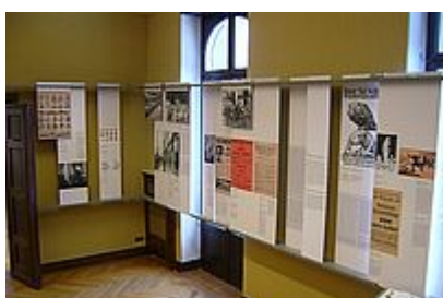
Εκθεσιακός χώρος 3