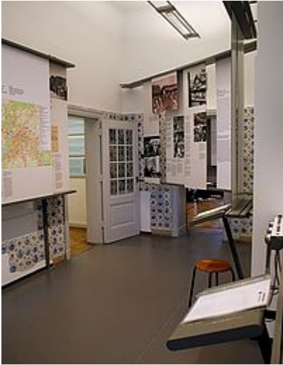
Εκθεσιακός χώρος 14