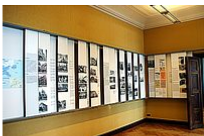
Εκθεσιακός χώρος 3