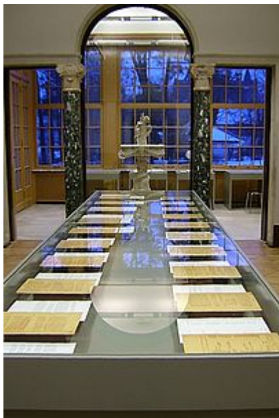
Εκθεσιακός χώρος 9