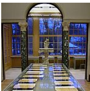
exposición, sala 9