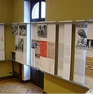
exposición, sala 3