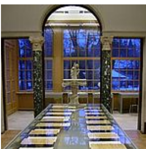
exposición, sala 9