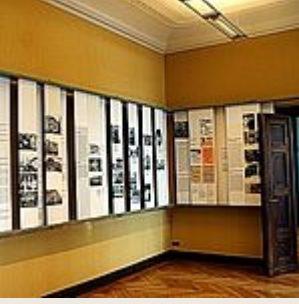
exposición, sala 3