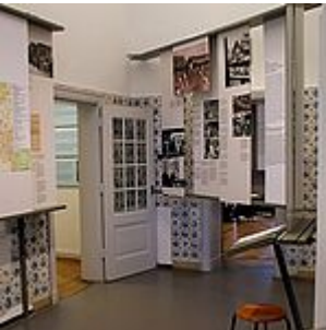
exposición, sala 14