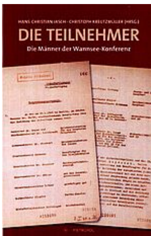
Jasch u. Kreuzmüller: Die Teilnehmer - Die Männer an der Wannsee-Konferenz. Berlin 2017