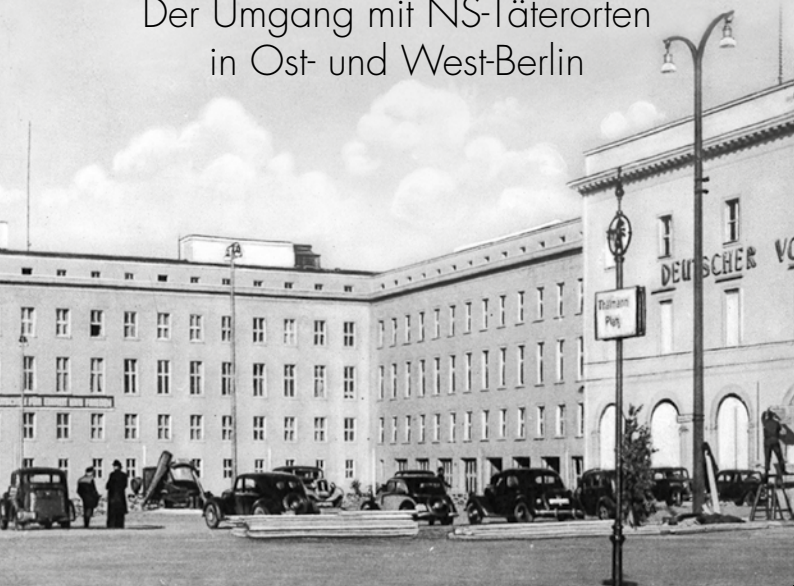
Thälmannplatz, Berlin, 1949, Foto: Schumann (Postkartendetail)

Der Umgang mit NS-Täterorten in Ost- und West-Berlin