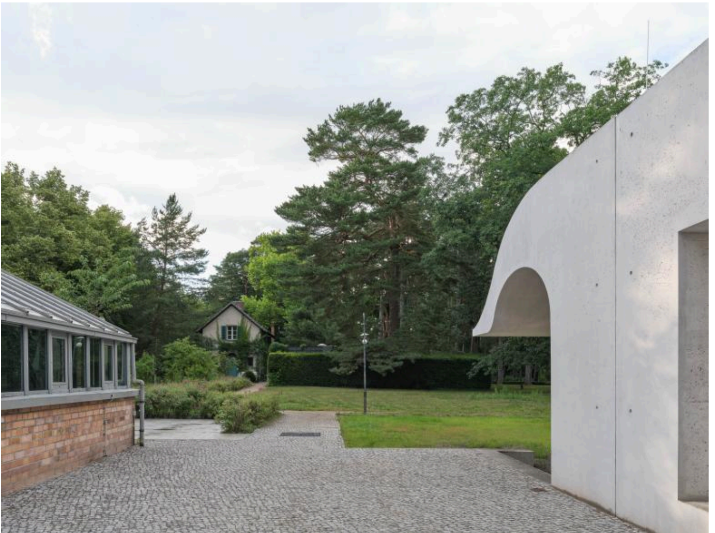
Gelungen ist die Gestaltung des Bereichs zwischen Neubau und einstigem Gärtnerhaus. Der Außenraum bietet trotz seines schmalen Zuschnitts eine hohe Aufenthaltsqualität.