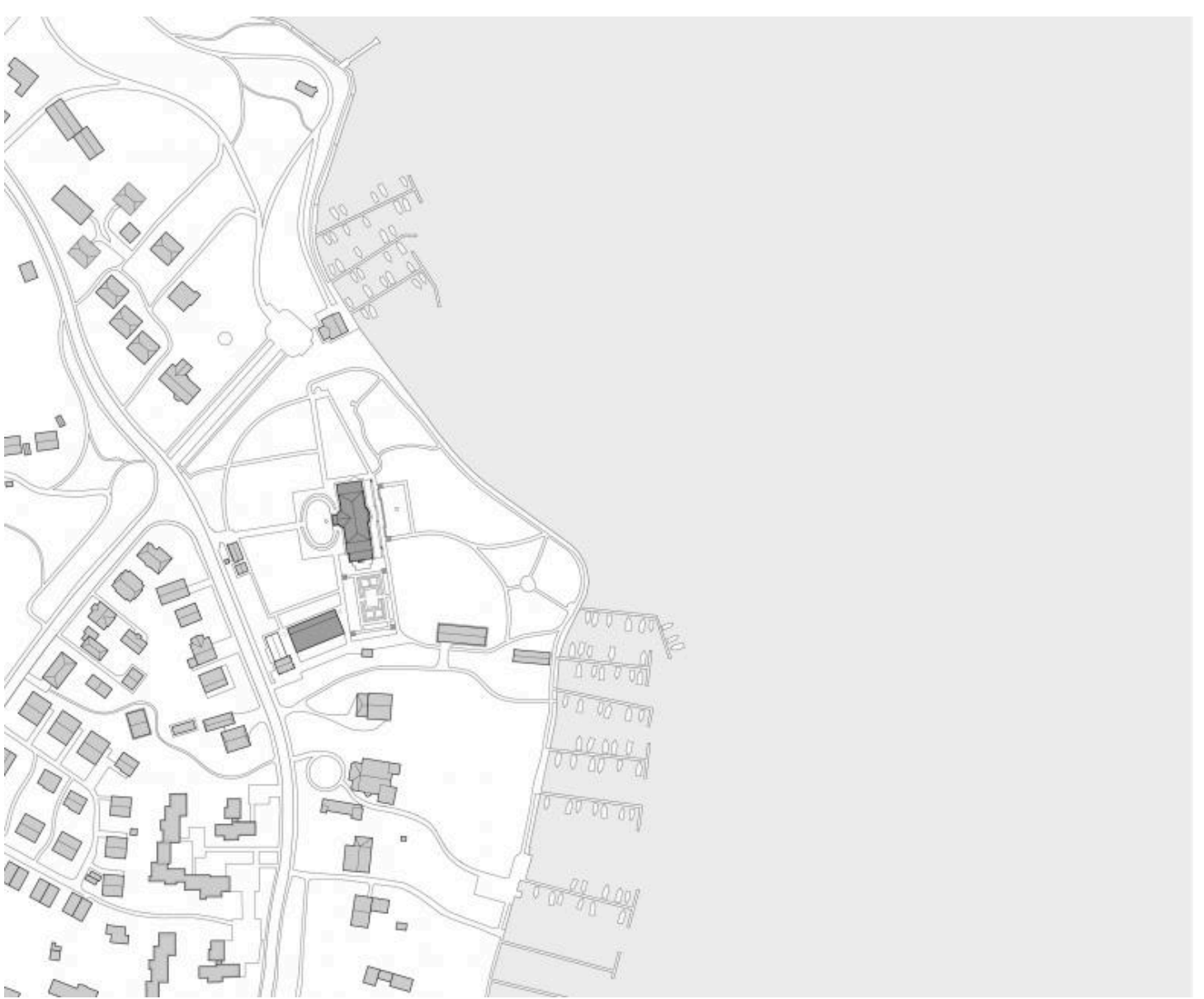
Situation (© Staab Architekten)