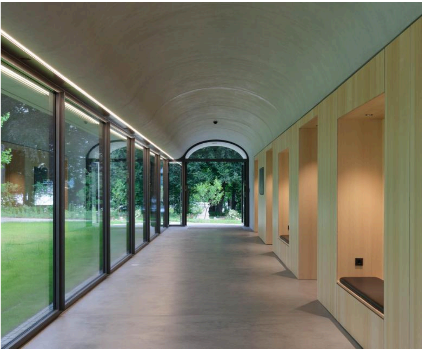
Kraftvoll ist der Kontrast zwischen Betongewölbe und raumhoher Fensterfront des Foyers und den Holzeinbauten der Seminarräume.