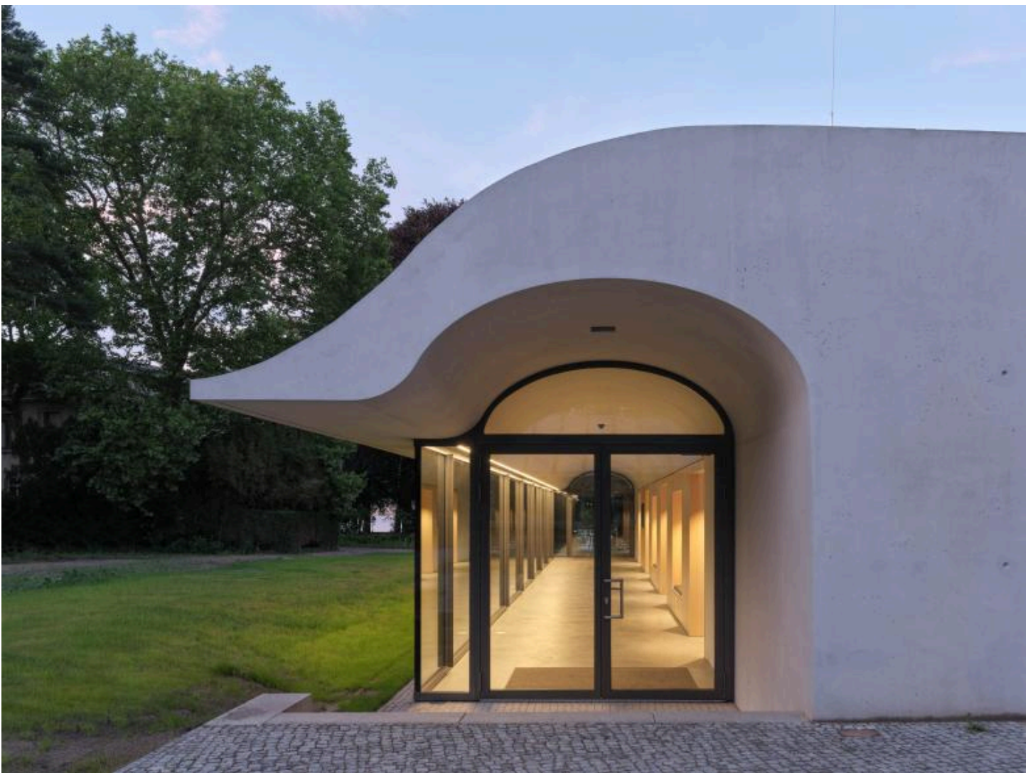
Blick auf das verglaste Foyer unter dem weit ausschwingenden Dach.

Der Bau steht am Südrand des Grundstücks zwischen dem Rosengarten und dem früheren Gärtnerhaus, das heute eine Cafeteria ist. Zu drei Seiten hat das Seminarhaus geschlossene Sichtbetonfassaden, zum Garten und zur Villa hin öffnet es sich mit einem gläsernen Foyer, das vom weit ausschwingenden Dach überwölbt wird. Warum entschieden sich die Architekten für diese extravagante Geste? Zum einen soll die Wellenform des Gewölbes zwischen dem sonst sehr schlichten Neubau und dem denkmalgeschützten Haupthaus vermitteln. Andererseits ging es auch darum, dem Seminarhaus bei aller Zurückhaltung ein unverwechselbares Gesicht zu geben. Die Wettbewerbsjury bewertete das als »angemessen« und »manieriert« zugleich. Schlussendlich belohnte sie den Mut zur absichtsvollen Form.