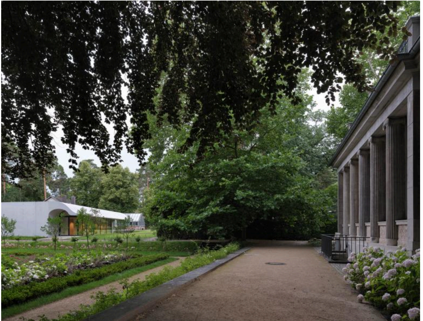
Das Seminarhaus steht am südlichen Rand des Grundstücks und öffnet sich zum Garten und zur Villa als Schauplatz der Wannsee-Konferenz.

2015 schrieb Berlins Senatsverwaltung für Stadtentwicklung und Wohnen einen Wettbewerb aus, den Staab Architekten vor den Büros Brückner & Brückner und Marte.Marte gewannen. Ihr Entwurf polarisierte zunächst und wurde von der Jury unter der Leitung Florian Naglers intensiv diskutiert, am Ende aber einstimmig zur Weiterbearbeitung empfohlen. Den Ausschlag gab vor allem, dass die Berliner Architekten sich für einen liegenden Baukörper entschieden hatten, der mit seiner niedrigen Höhe zu den Nachbargebäuden passt. Am 8. Oktober nun wurde das Seminargebäude eingeweiht.