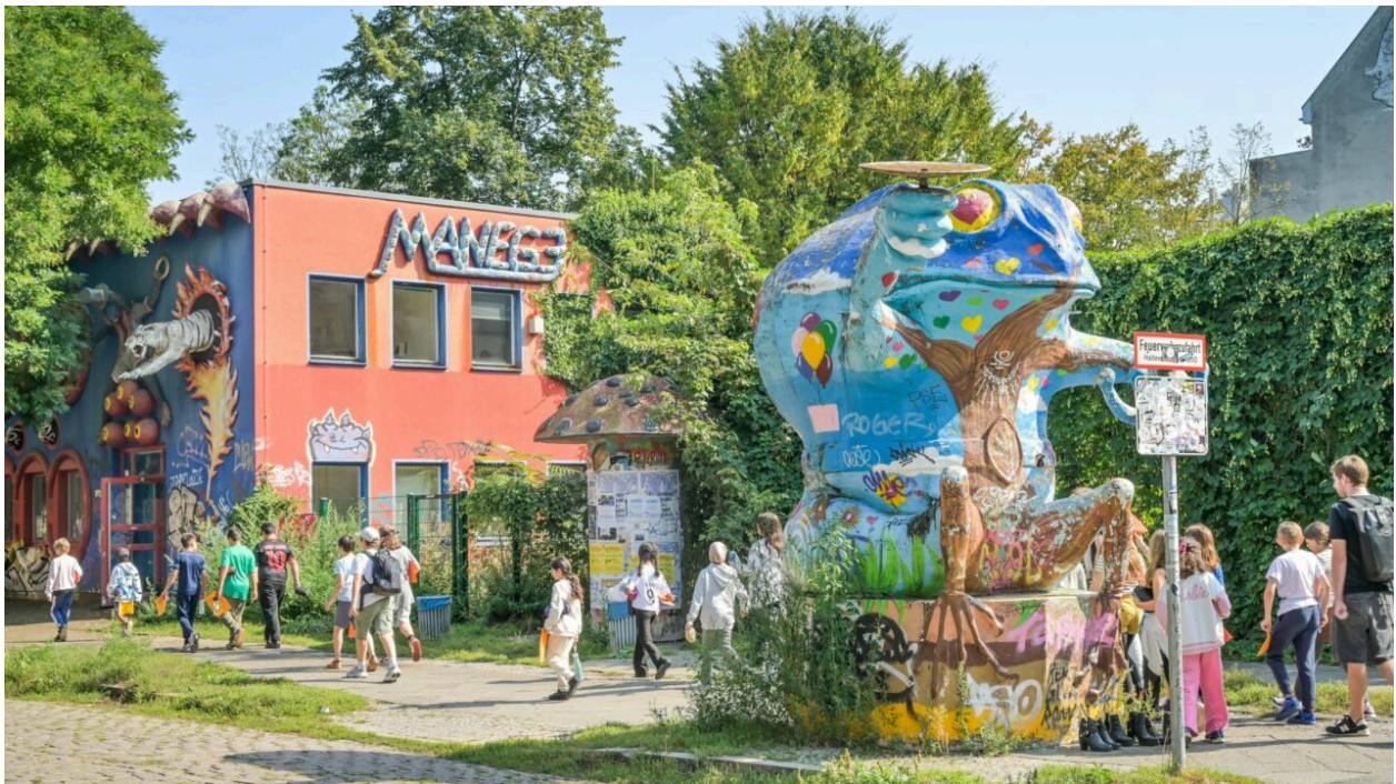
Eingang zum Campus Rütli in Berlin, Neukölln

Im Jahr 2021 erschien „ Mehr als zwei Seiten “: Ein Comic, der auf einer Reise von Neuköllner Schüler*innen nach Israel basiert und von kontroversen Diskussionen, Ängsten und Vorurteilen der Jugendlichen erzählt.