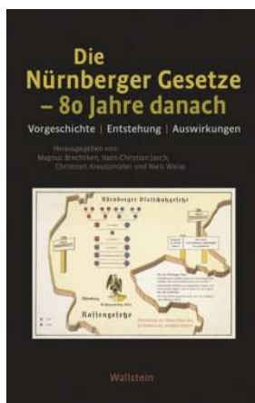
M. Brechtken, H. Jasch, C. Kreuzmüller, N. Weise (Herausgeber): Die Nürnberger Gesetze - 80 Jahre danach. Vorgeschichte, Entstehung, Auswirkungen. WallsteinVerlag, Göttingen 2017, 311 Seiten. 29,90 Euro. E-Book: 23,99 Euro. (Foto:.)

Die Nationalsozialisten hatten es mit dem Blut. Und das Erstaunliche war - sie glaubten wirklich an diesen eugenischen Unsinn, auch wenn sie sich alle Mühe gaben, die behauptete "Gefahr" durch die Juden künstlich zu erschaffen - durch das Phantasma von der Übermacht des jüdischen Blutes über das "arische". Der völkische Antisemitismus mit seinem Blutaberglauben wurde mit den "Blutschutz"-Gesetzen zur Staatsdoktrin. Der sich in den Rassegesetzen niedergeschlagene Blutkult der Nazis machte es für viele Deutsche lebensnotwendig, Ahnenforschung zu betreiben und einen "Arier-Nachweis" beizubringen. So blieb es nicht aus, dass sich auch der Flüsterwitz mit dem "Arier" beschäftigte. "Was ist ein Arier?" Antwort: "Das Hinterteil von einem Proletarier". In England lautete die Pointe so: "There are only two kinds of people left in Germany: non-Aryans and bab-Aryans."