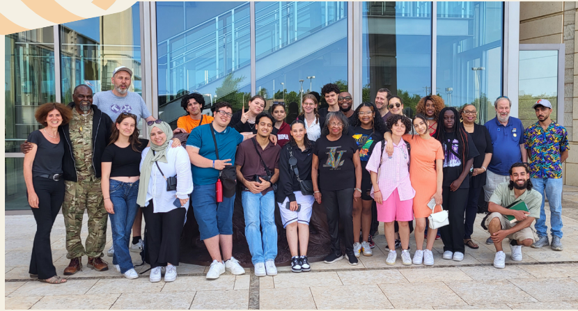
Teilnehmer:innen der Studienreise, Oklahoma, USA, Juni 2023 Participants in the study trip to the U.S. state of Oklahoma, June 2023

A study trip by the Remember working group to the U.S. state of Oklahoma