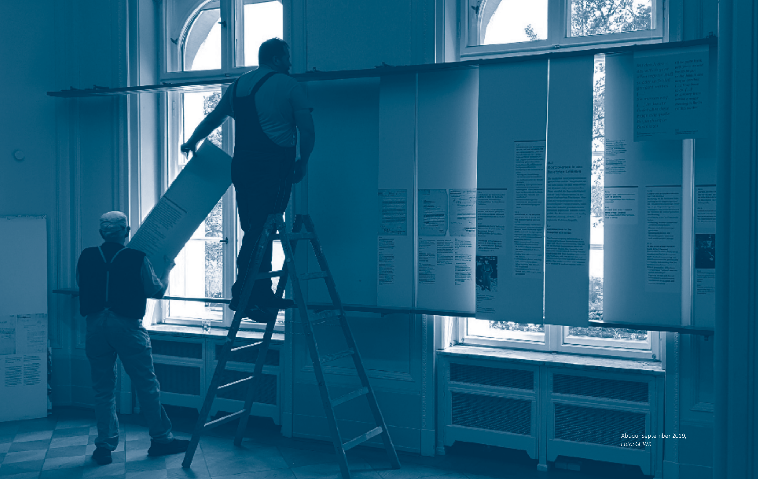
Abbau, September 2019, Foto: GHWK