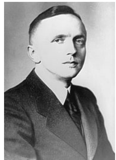
Gerhard Klopfer (1905-1987)

Wie verlief nun Gerhard Klopfers weiterer Weg in diesem Umfeld? Dass er seine Aufgaben in der Partei-Kanzlei offenbar tadellos erledigte, zeigt der schnelle Verlauf seiner Karriere mit dem Aufstieg vom Ministerialrat (1938) zum Ministerialdirigent (1939), zwei Jahre später zum Ministerialdirektor.