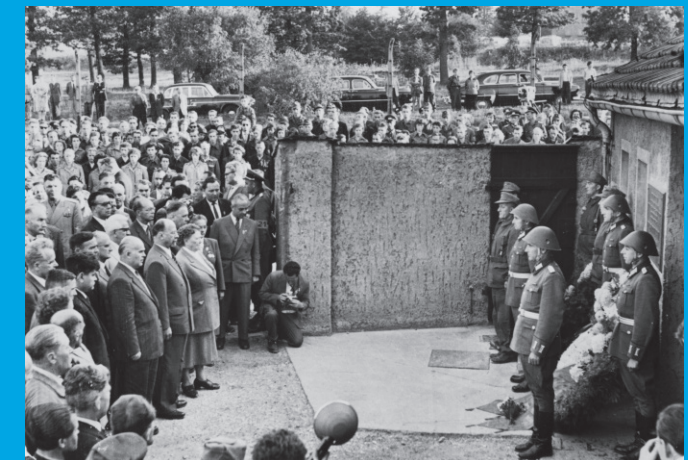
Walter Ulbricht im Jahr 1958 im ehemaligen Konzentrationslager Buchenwald