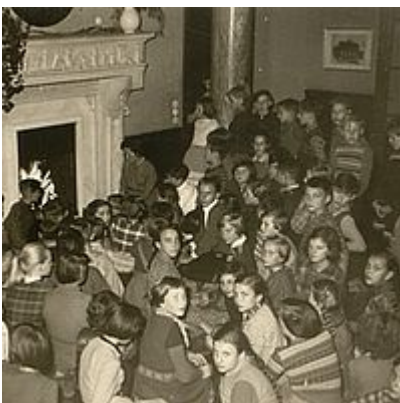
Schüler vor dem Marmorkamin in der Eingangshalle, 1956