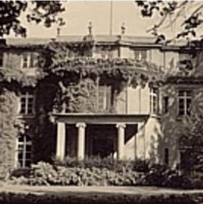
Schullandheim Neukölln, 1956