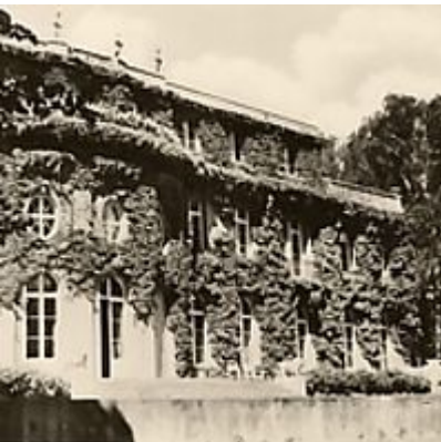
Schullandheim Neukölln, (Postkarte) 1958