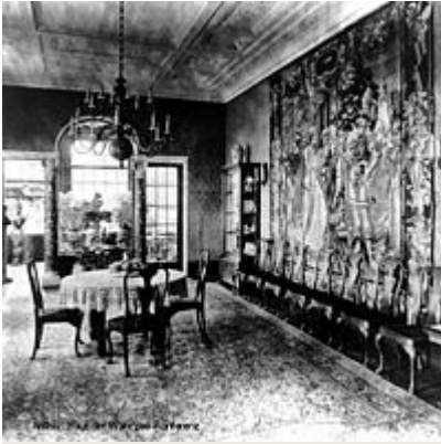
Speisezimmer Villa Minoux, 1922