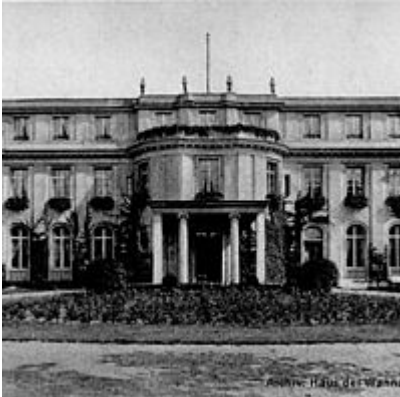
Die Villa Marlier, um 1916