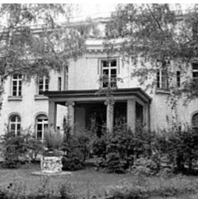
Die Villa, 1986