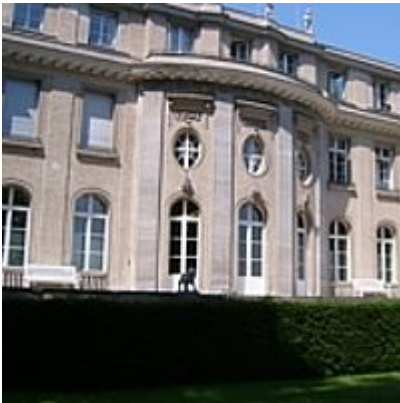
Die Villa, 2005