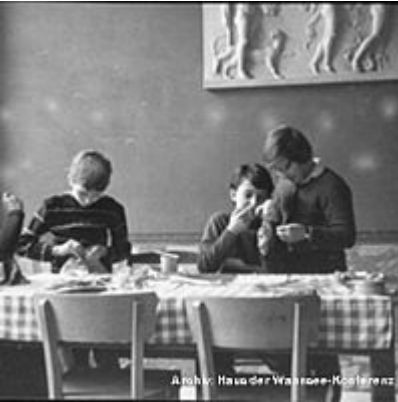
Schüler im Wintergarten, 1956