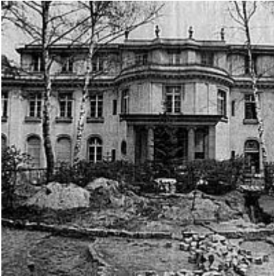
Die Villa nach dem Auszug des Schullandheims, 1988