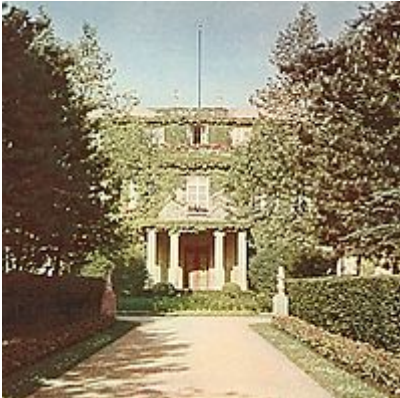
Die Villa um 1940