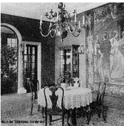
Speisezimmer Villa Marlier, 1916