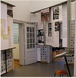
Ausstellung, Raum 14