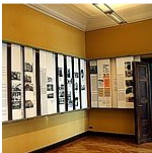
Ausstellung, Raum 3