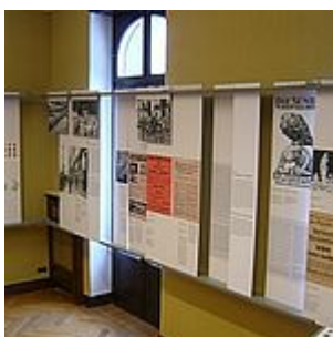
Ausstellung, Raum 3