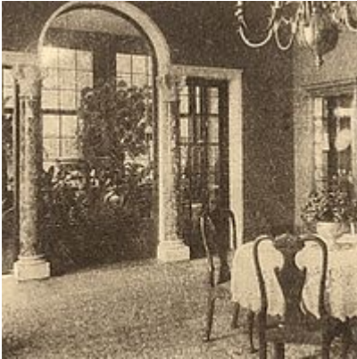
Das Speisezimmer mit anschließendem Wintergarten