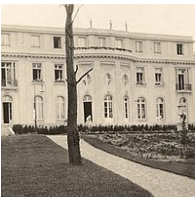
Die Seeseite der Villa