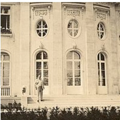
Ernst und Margarete Marlier auf der großen Terrasse