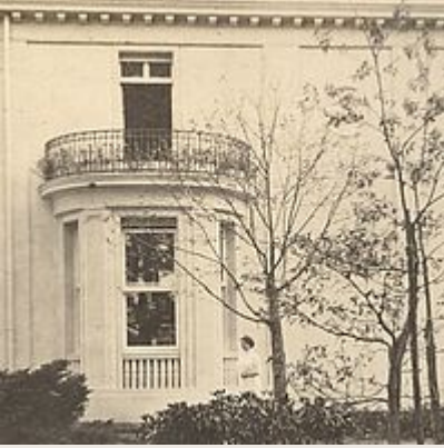
Die Nordseite der Villa mit dem Erker