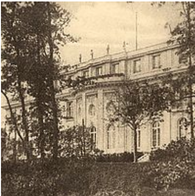
Die Villa (Seeseite)