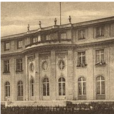
Die Seeseite der Villa mit der großen Terrasse