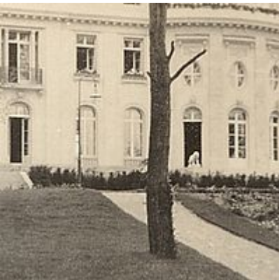
Die Seeseite der Villa