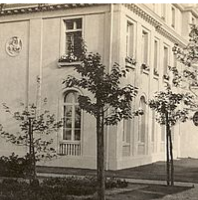
Die Nordseite der Villa