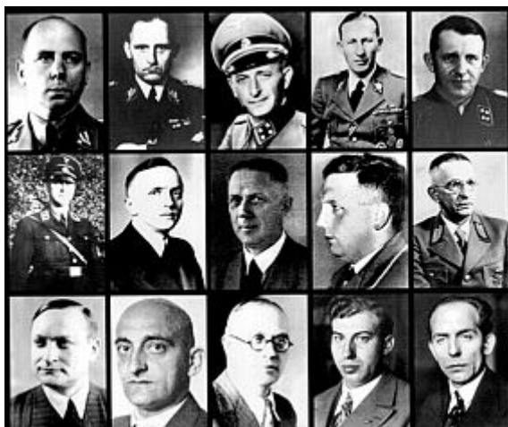
המשתתפים בוועידה ב-20 בינואר 1942