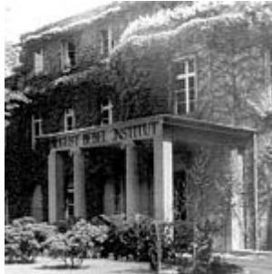
מכון אוגוסט בבל, 1948