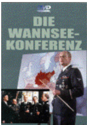
DVD "Die Wannsee-Konferenz". 1984