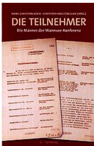
Jasch u. Kreutzmüller: Die Teilnehmer - Die Männer an der Wannsee-Konferenz. Berlin 2017

Die Teilnehmer - Die Männer an der Wannsee-Konferenz.