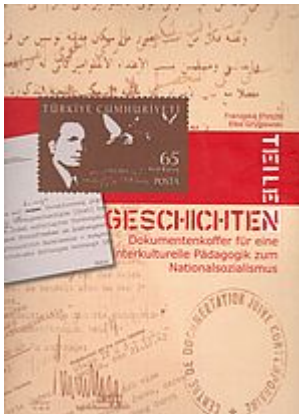
DokumentenKoffer "Geschichten teilen". Berlin 2015