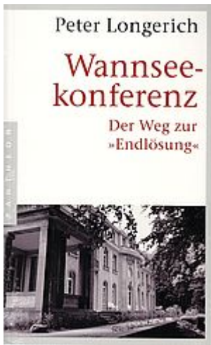
Longerich, P.: Wannseekonferenz. 2016

Wannseekonferenz. Der Weg zur "Endlösung".