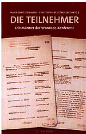
Jasch u. Kreuzmüller: Die Teilnehmer - Die Männer an der Wannsee-Konferenz. Berlin 2017

Die Lieferung erfolgt gegen Vorausrechnung + Porto.