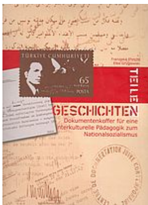
Dokumentenkoffer "Geschichten teilen". Berlin [Nachdruck] 2015.

Villencolonie Alsen am Großen Wannsee. Begleitband zur Ausstellung in der Gedenk- und Bildungsstätte Haus der Wannsee- Konferenz. Hrsg. von Michael Haupt. Berlin: Haus der Wannsee-Konferenz 2012 (Nachdruck 2017), 168 S. mit 184 Abb. ISBN 978-3-9813119-3-8, 7,50 EUR