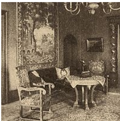
De Herrenzimmer van Ernst Marlier