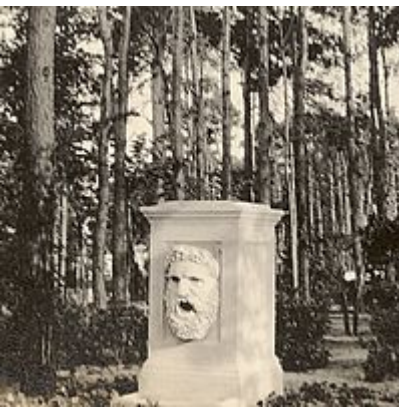
De marmere fontein