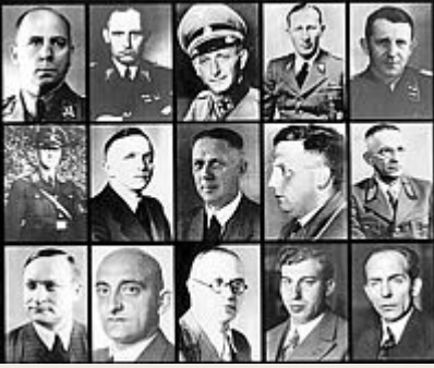
Die 15 Teilnehmer an der Konferenz vom 20. Januar 1942